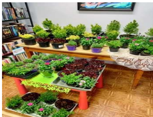
Zdjęcie 11 Akcja Sadzonki dla czytelników w ramach "Tygodnia Bibliotek"