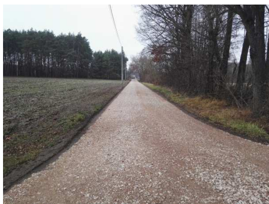
Zdjęcie 2 Wykonana droga i oświetlenie w m. Zabiełłów