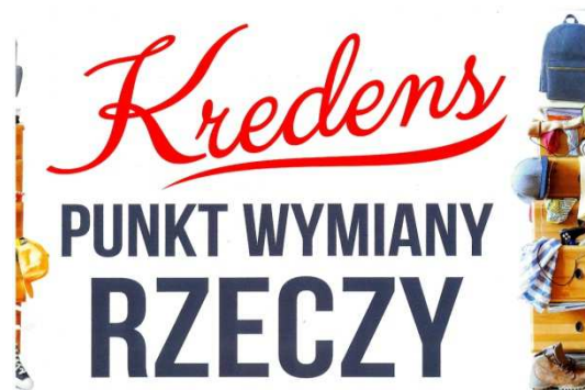
Zdjęcie 1 Logo Punktu Wymiany Rzeczy "Kredens"

Punkt Wymiany Rzeczy „Kredens” to miejsce gdzie można zostawić jak i otrzymać za darmo m.in. różnego rodzaju sprzęty domowe, ubrania, obuwie, zabawki, artykuły dziecięce. Jedynym warunkiem przyjęcia przedmiotu jest jego dobry stan techniczny umożliwiającą dalsze użytkowanie.