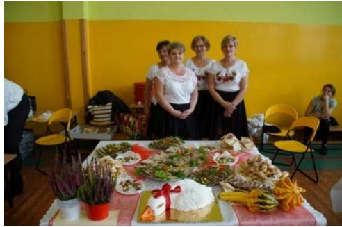
Zdjęcie 19 Święto Niepodległości 2021