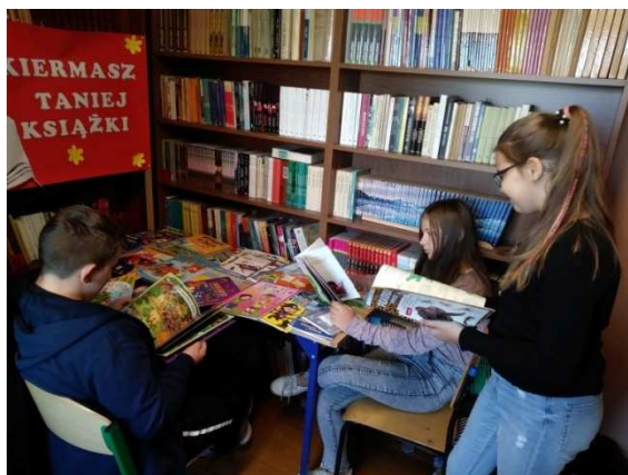
Zdjęcie 7 SP Rasy - Kiermasz Taniej Książki