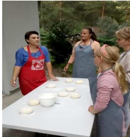
Zdjęcie 14 Warsztaty Kuchni Gruzjińskiej