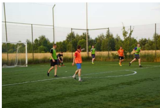
Zdjęcie 26 Turniej Piłki Nożnej i Rzutów Karnych "KOPNIJ RAKA" 2021