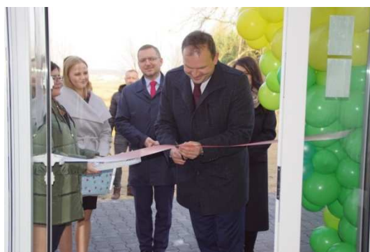
Zdjęcie 5 Oficjalne otwarcie Gminnego Żłobka w Drużbicach