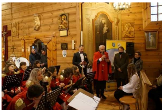
Zdjęcie 24 20 – lecie „Orkiestry Dętej Suchcice i Okolice”

Tuż przed Świątami Bożego Narodzenia, Biblioteka przy pomocy Urzędu Gminy, Radnych Gminnych, Sołtysów i wolontariuszy zorganizowała akcję „Świąteczna Paczka dla samotnych”. W ramach tej akcji 60 osoby samotne otrzymały świąteczny upominek. Ponadto do osób z terenu gminy Drużbice, które w tym czasie przebywały w placówkach zapewniających całodobową opiekę, zostały wysłane kartki z życzeniami świątecznymi.