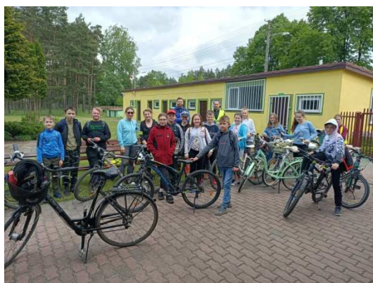
Zdjęcie 8 SP Wadlew - Wirtualny Charytatywny Rajd Rowerowy

Inwestycja w oświatę to nie tylko środki finansowe na remonty, modernizację obiektów, ale przede wszystkim inwestycja w ludzi. Co roku środki z budżetu Gminy są przekazywane na kształcenie nauczycieli i pedagogów: wsparcie finansowe udziału w studiach podyplomowych, kursach kwalifikacyjnych – w 2021 roku pozytywnie rozpatrzono 4 wnioski nauczycieli o wsparcie finansowe, na co przeznaczono 6 000,00 zł. Ponadto w planach finansowych szkół i placówek, co roku planuje się środki na doskonalenie Rad Pedagogicznych. W 2021 roku na ten cel została przeznaczona kwota 7 130,00 zł.