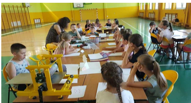
Zdjęcie 13 Wakacje z Biblioteką 2021