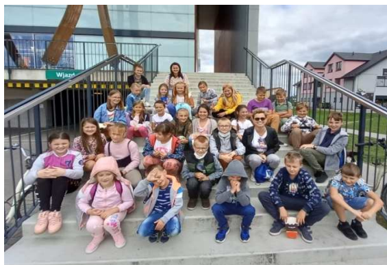
Zdjęcie 16 Zakończenie wakacji z Biblioteką - wyjazd do kina