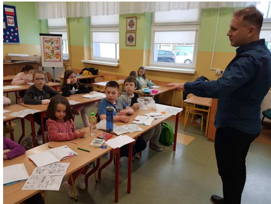
Zdjęcie 10 Aktywne Ferie z Biblioteką