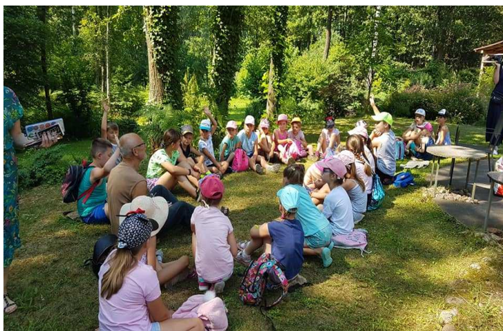
Zdjęcie 12 Wakacje z biblioteką 2021

W zajęciach każdego dnia brało udział średnio około 25 osób.