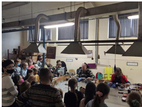
Zdjęcie 21 Wizyta w Mediatece w Piotrkowie Trybunalskim

20. „Wycieczka dla Małych i Dużych” - wizyta w Mediatece 800 lecia w Piotrkowie Trybunalskim, zabawa w Strefie Odkrywania Wyobraźni i Aktywności Sowa i warsztaty w Fabryce Bombek w Piotrkowie Trybunalskim. W wycieczce wzięło udział 35 osób.