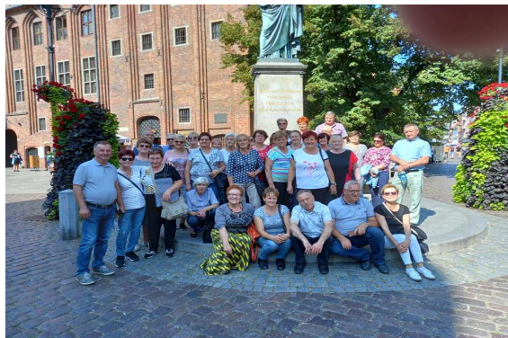
Zdjęcie 15 Wycieczka nad morze