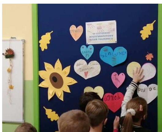
Zdjęcie 6 ZSP Drużbice – Obchody Międzynarodowego Dnia Tolerancji

Wszystkie placówki oświaty biorą czynny udział w wielu akcjach i projektach edukacyjnych, które wspierają ogólny rozwój dzieci. W realizowanych projektach uczniowie nie tylko rozwijają umiejętności w dziedzinach szkolnych, takich jak matematyka czy historia, ale również uczą się zachowań interpersonalnych. Szkoły biorą też czynny udział w akcjach charytatywnych a rzecz osób potrzebujących, a także w wielu akcjach ekologicznych, np. zbiórkach zużytych opakowań po tuszach do drukarek.. Ponadto uczniowie uczestniczą w licznych konkursach rangi gminnej, powiatowe, wojewódzkiej, a nawet ogólnopolskiej, niejednokrotnie zajmując czołowe miejsca.