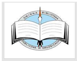
Zdjęcie 25 Logo Gminnej Biblioteki Publicznej w Drużbicach

W trakcie roku 2021 Gminna Biblioteka Publiczna w Drużbicach udostępniła do oglądania wystawy: