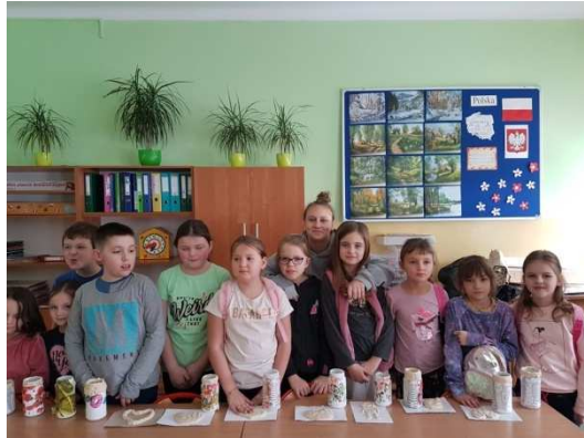
Zdjęcie 9 Aktywne Ferie z Biblioteką