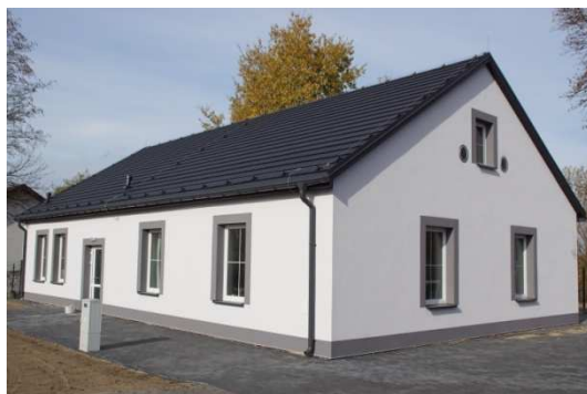
Zdjęcie 4 Budynek Gminnego Żłobka w Drużbicach

Do żłobka uczęszcza 24 dzieci z terenu gminy Drużbice, dzięki czemu ich opiekunowie mogli powrócić na rynek pracy.