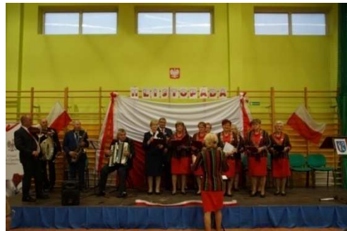
Zdjęcie 20 Święto Niepodległości 2021

19. Organizacja spotkania z Powiatowym Rzecznikiem Praw Konsumenta.