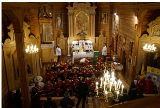
Zdjęcie 23 20 – lecie „Orkiestry Dętej Suchcice i Okolice”