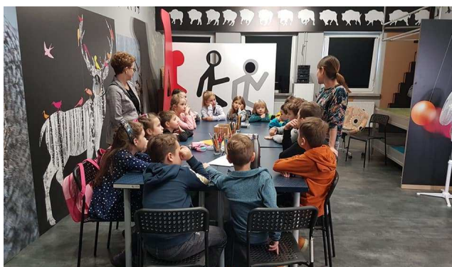
Zdjęcie 18 Ekologiczne Warsztaty Filmowe