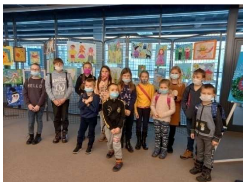
Zdjęcie 22 Wizyta w Fabryce Bombek