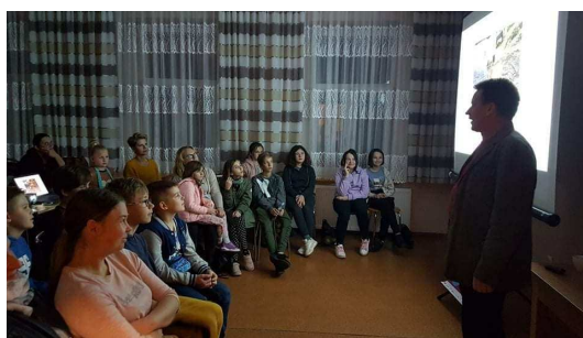
Zdjęcie 17 Noc Bibliotek 2021